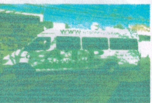
Servicio de Transporte