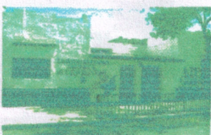
Jardín Atepeitos Capital