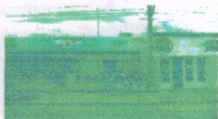
Colegio San Antonio de Padua

Único Gremio Con Instituciones Educativas