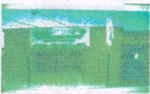
Jardín Atepeitos Milagro